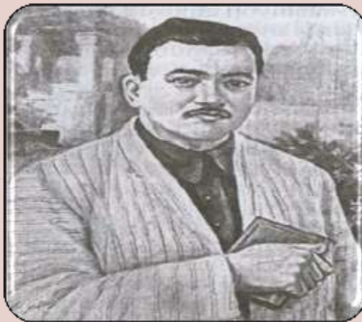
Абдулла Қодири “Ўткан кунлар”