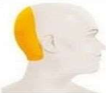
Гипертония Тяжелая пульсирующая боль, как правило, в области затылка