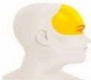
Грипп, ОРЗ Локальная боль в области надбровных дуг, висков и лба