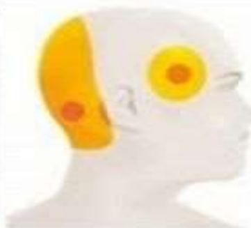
Остеохондроз Резкая боль при движении в затылочной части и у висков