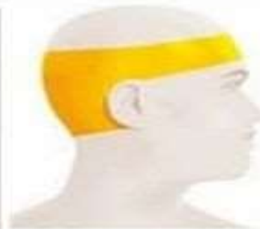
Стресс Длительная боль, "сжимающая" голову как обруч