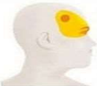
Мигрень Сильная пульсирующая боль в одном участке головы